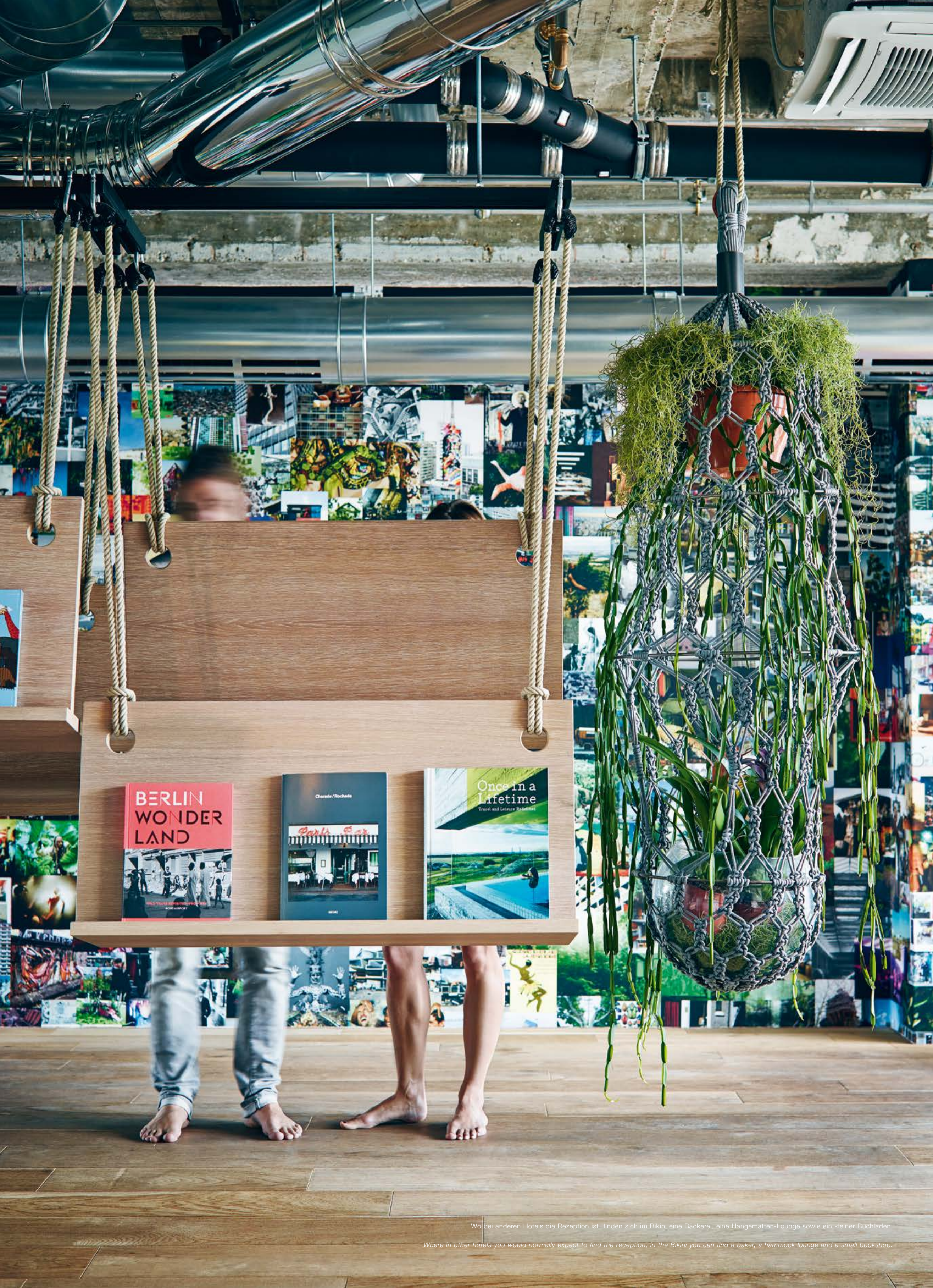
Wo bei anderen Hotels die Rezeption ist, finden sich im Bikini eine Bäckerei, eine Hängematten-Lounge sowie ein kleiner Buchladen. Where in other hotels you would normally expect to find the reception, in the Bikini you can find a baker, a hammock lounge and a small bookshop.