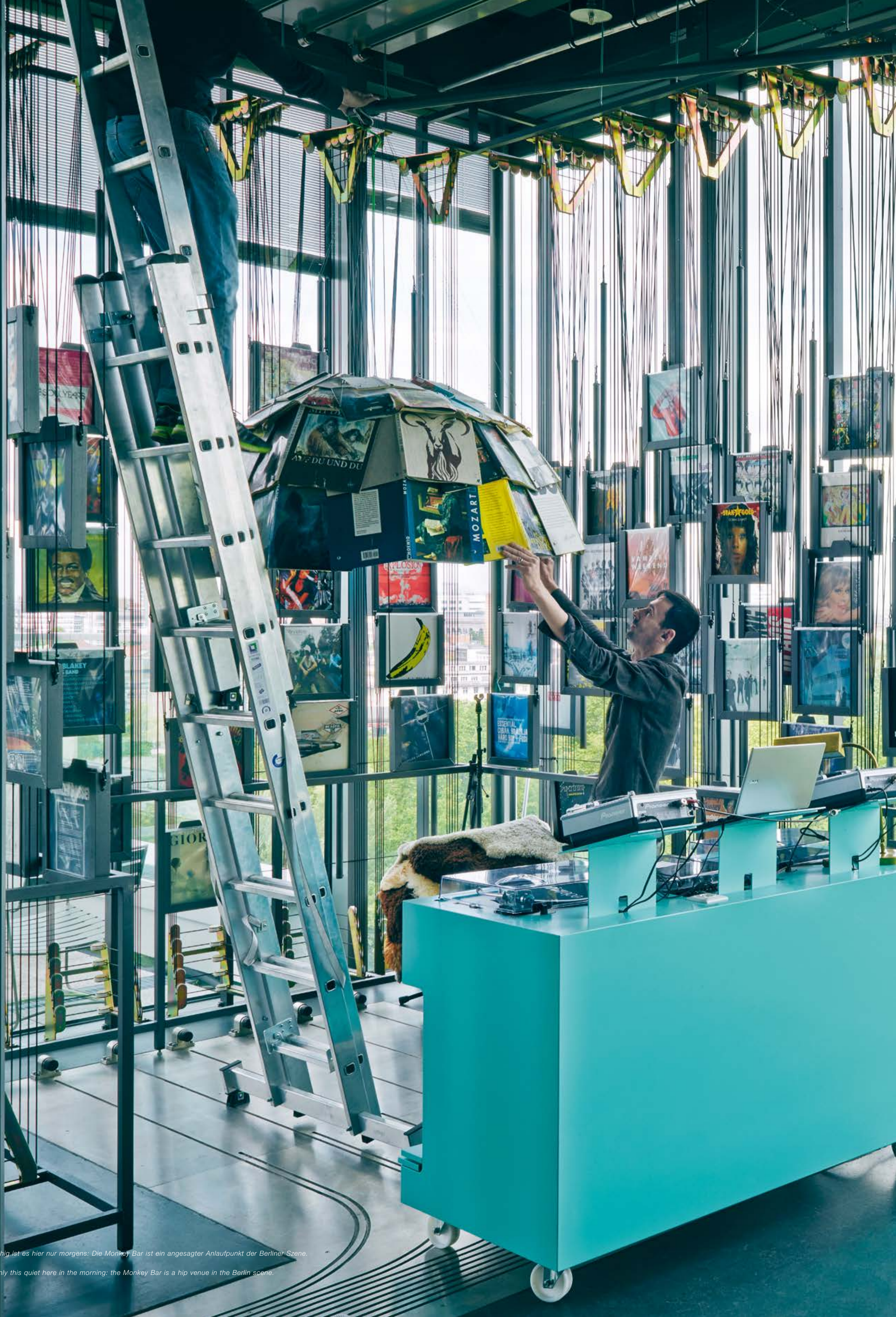
So ruhig ist es hier nur morgens: Die Monkey Bar ist ein angesagter Anlaufpunkt der Berliner Szene.