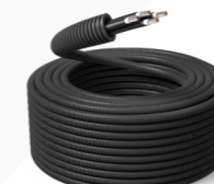
25 mm 4x6 UV R50 E-nr: 14 164 14