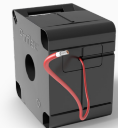
4mm 2 Röd X200 E-nr: 05 152 77