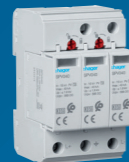
Överspänningsskydd T2 3P 40 kA Solcell E-nr: 52 715 99