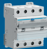
Personskyddsbrytare 4P typ A E-nr: 21 636 72