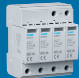
Överspänningsskydd T2 4P 40 kA E-nr: 52 715 84