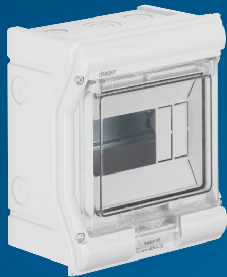
Vector utomhus UV 1 x 6 moduler E-nr: 22 816 97