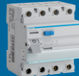
Jordfelsbrytare 4P typ A E-nr: 21 636 60