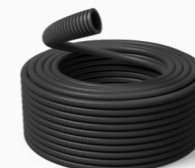
xSpeed 16 mm R100 E-nr: 14 139 10