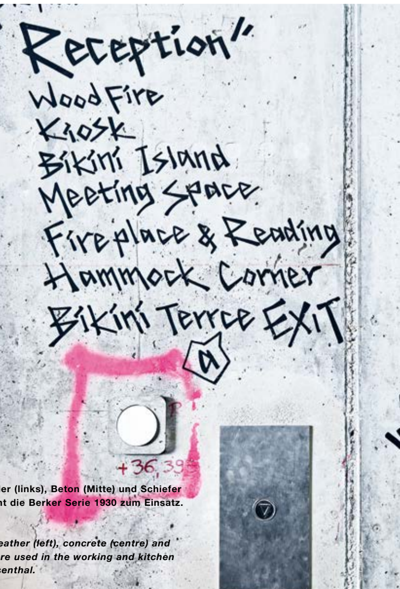
Authentisch wie das Bikini: Den Berker R.1 gibt es in den Rahmenvarianten Leder (links), Beton (Mitte) und Schiefer (rechts) sowie in Acryl und Eiche. In den Wirtschafts- und Küchenräumen kommt die Berker Serie 1930 zum Einsatz. Ihre porzellanene Variante wird in Koproduktion mit Rosenthal hergestellt. As authentic as the Bikini: the Berker R.1 is available with the frame versions leather (left), concrete (centre) and slate (right) such as acrylic and oak. The Berker Serie 1930 range of switches are used in the working and kitchen areas. The porcelain version of these switches is manufactured jointly with Rosenthal.