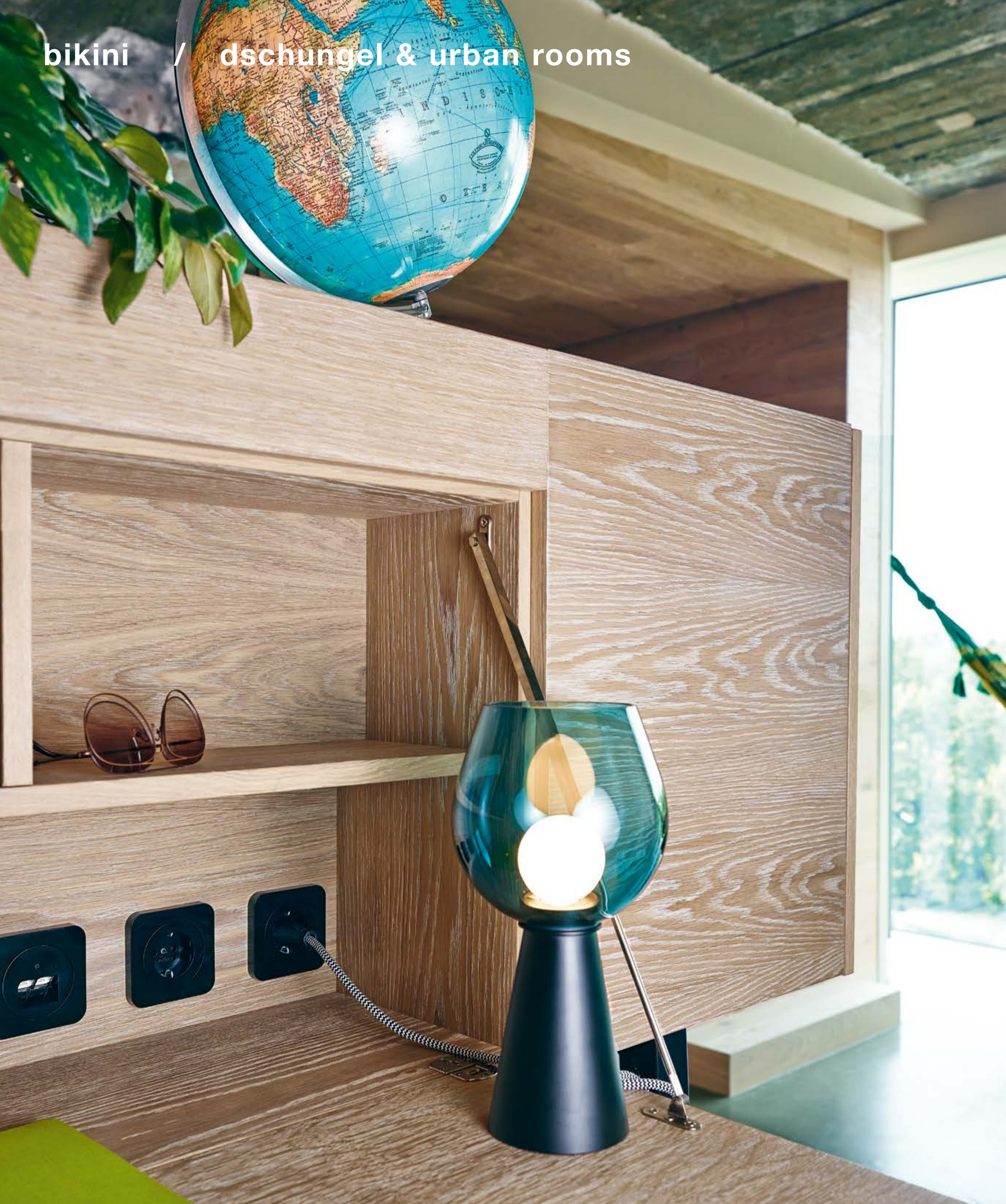
Der Berker R.1 sorgt im ganzen Haus für besten Anschluss zu Strom und Daten. The Berker R.1 ensures the best connection throughout the entire building.