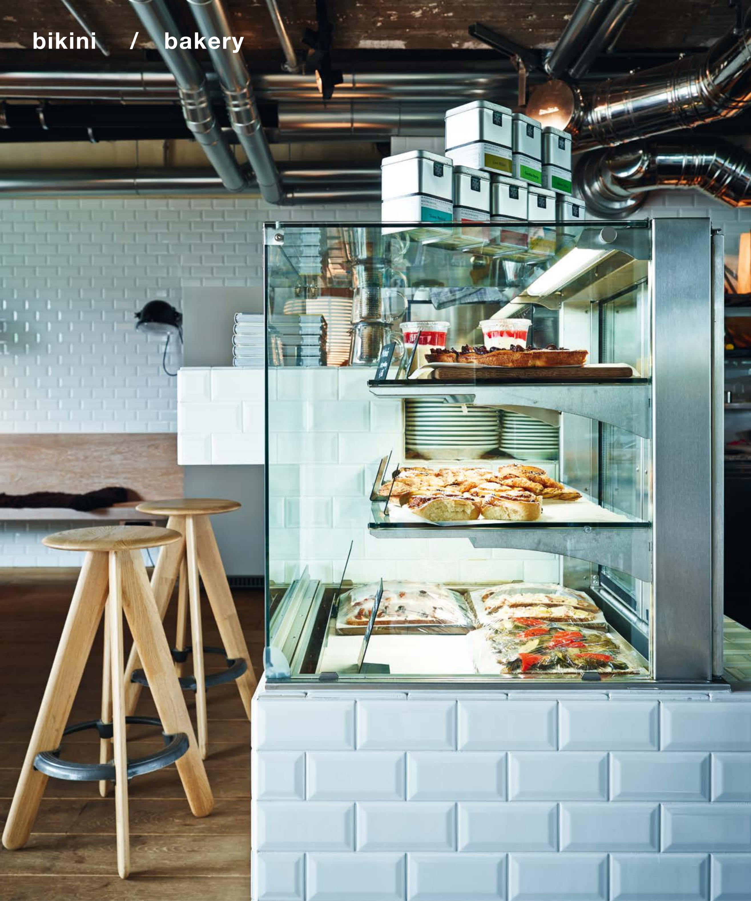
Das Brot liefert eine Berliner Bäckerei, die Sandwiches wandern vor Ort in den Holzofen: Die Bakery des Bikini. The bread is supplied by a Berlin bakery, the sandwiches move into the on-site wood-fired oven: the bakery at the Bikini.