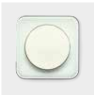
Passend dazu: Berker R.1, Glas polarweiß glänzend