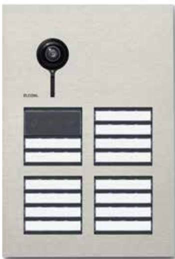
Video-Außenstation ELCOM.ONE – für 14 Wohneinheiten, mit Zustandsanzeige