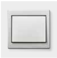
Passend dazu: Berker K.5, Aluminium