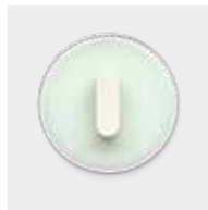
oder: Berker Serie R.classic, Glas polarweiß glänzend