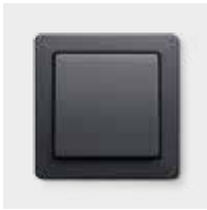
Passend dazu: Berker Q.1, anthrazit