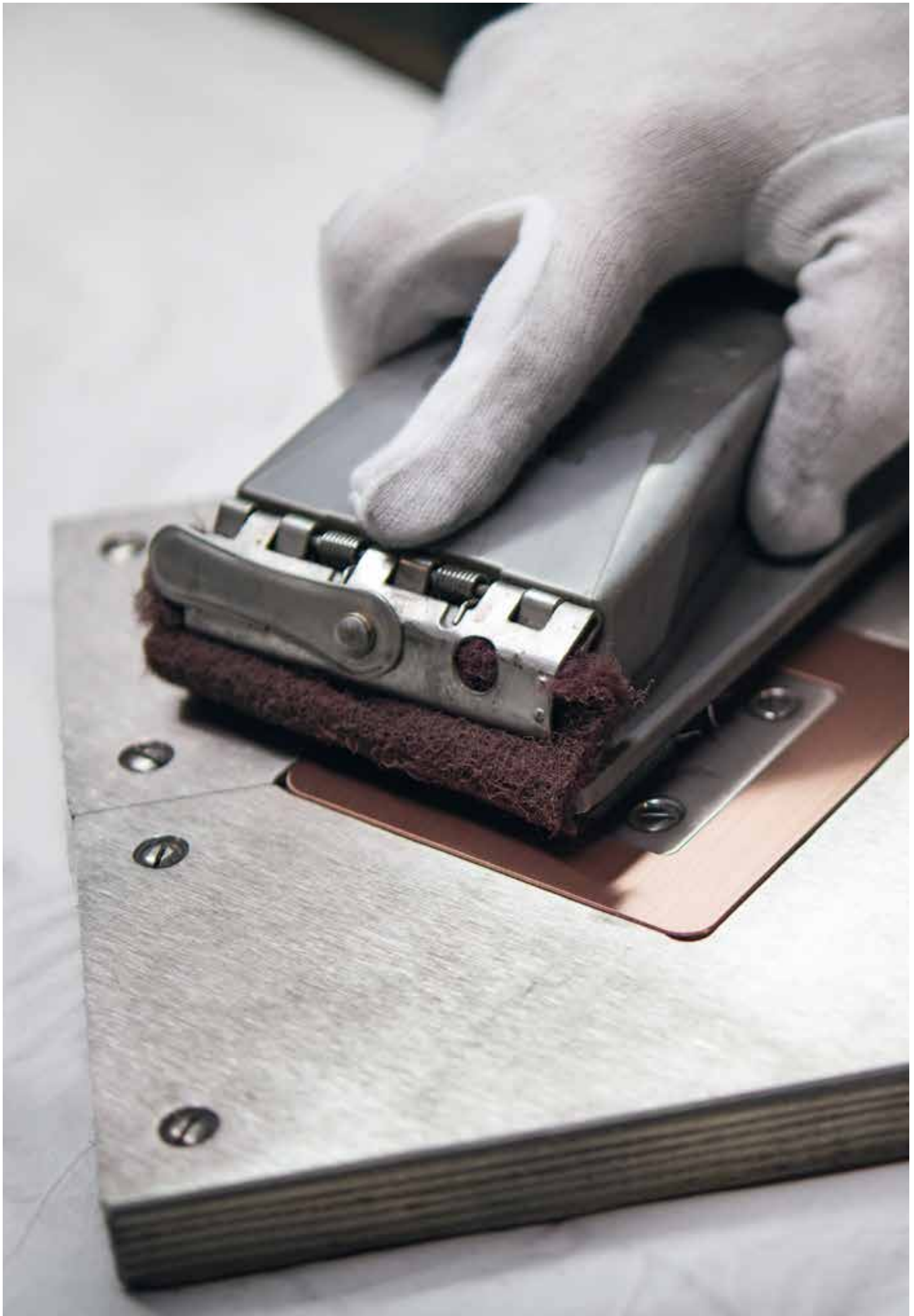
Beispiel: Berker Q.7 in Kupfer gebürstet