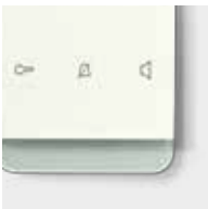
ELCOM.TOUCH polarweiß matt Rahmen: rund, Glas polarweiß