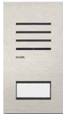
Außenstation ELCOM.ONE – in Video- und Audioausführung