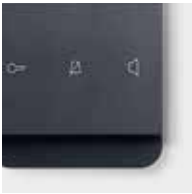
ELCOM.TOUCH anthrazit Rahmen: rund, anthrazit