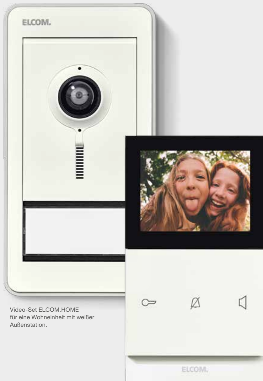
Video-Set ELCOM.HOME für eine Wohneinheit mit weißer Außenstation.