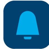
elcom access App

Das Access Gate verbindet die Türsprechanlage mit Ihrem Smartphone. So können Sie jederzeit sehen, wer vor Ihrer Tür steht.