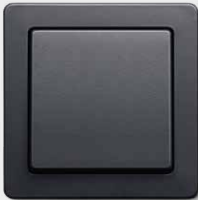
Berker Q.1, anthrazit

Zwei, die zusammengehören: Elcom Innenstationen passen perfekt zum Schalter- und Steck- dosen-Programm von Berker.