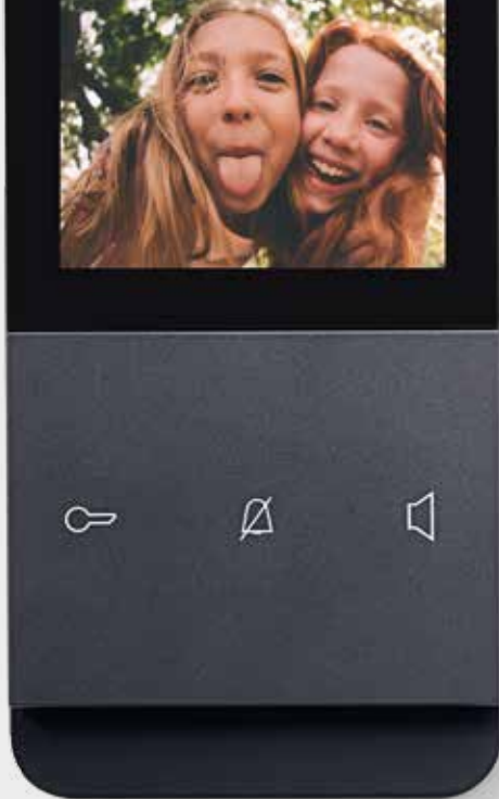
Video-Innenstation ELCOM.TOUCH, anthrazit