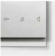
ELCOM.TOUCH alu matt lackiert Rahmen: eckig alu matt lackiert